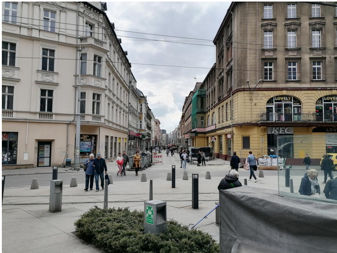
ul. Dworcowa. Częściowo odnowione zabytkowe kamienice ulicy śródmiejskiej