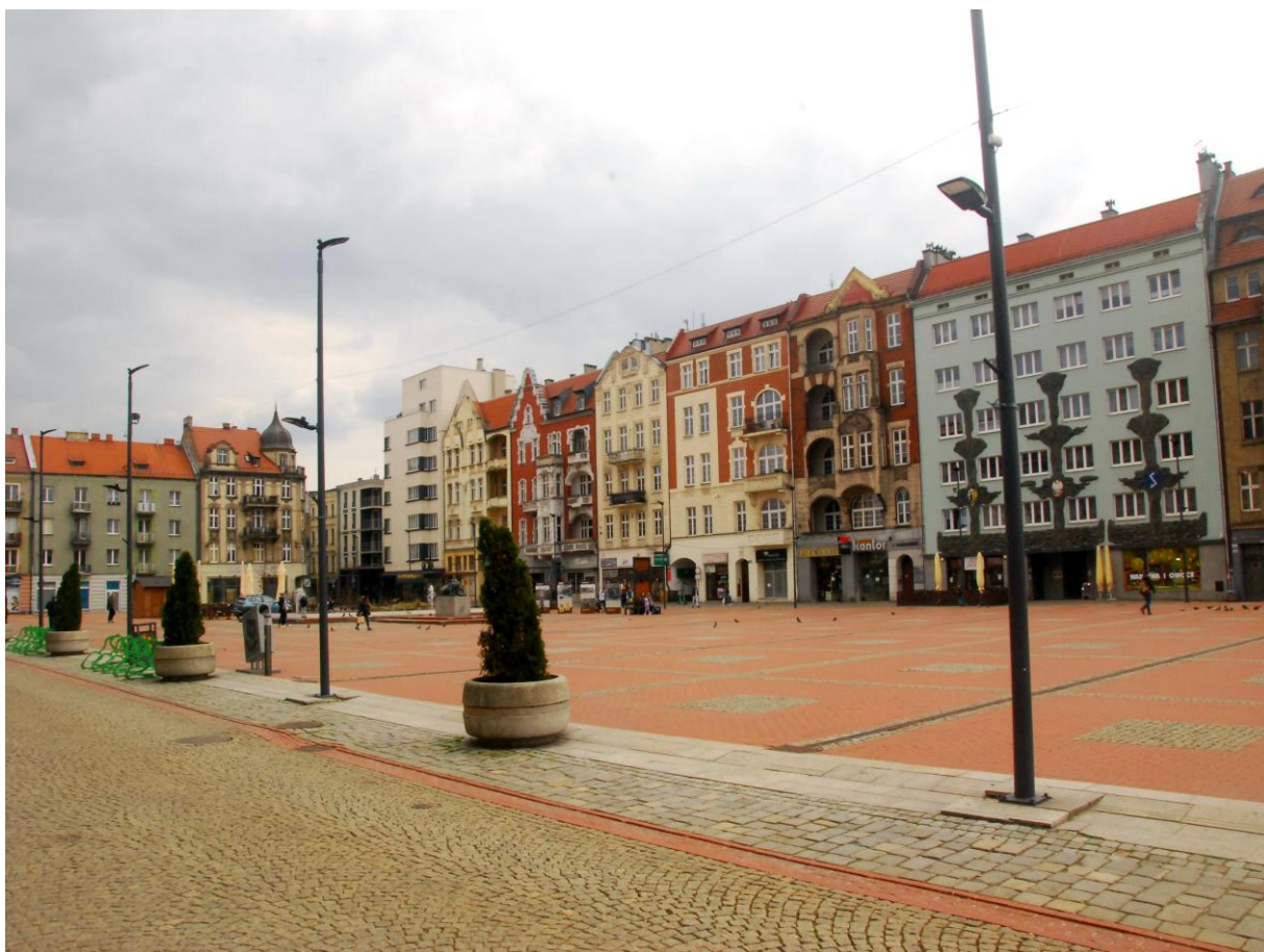
Rynek. Część odnowionych kamienic