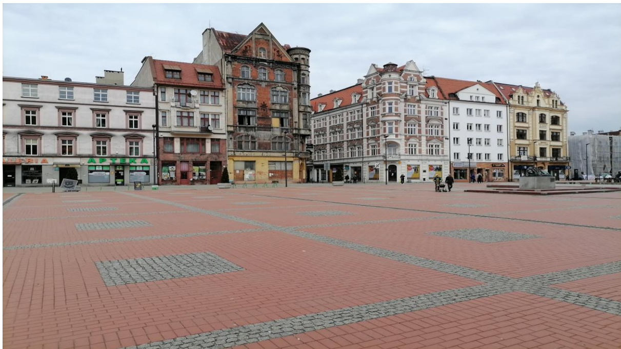
Rynek. Zabytkowe kamienice. Brak zieleni.