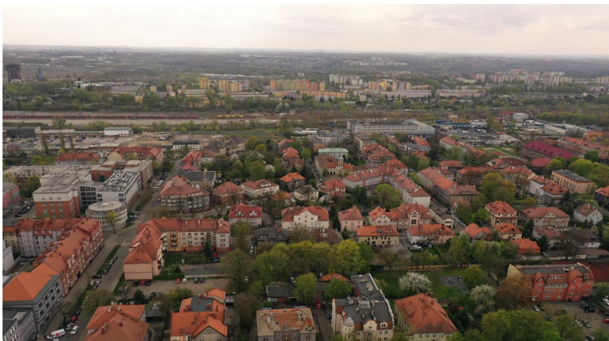
ul. Gen. Niedźwiadka-Okulickiego. Zabytkowy układ przedwojennych kamienic.